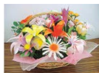
一例として退職する社員に対し、 廃材を利用して花束を作り、退 職時に贈呈しています。